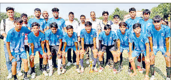
महेंद्रगढ़। ट्रॉफी के साथ विजेता टीम।