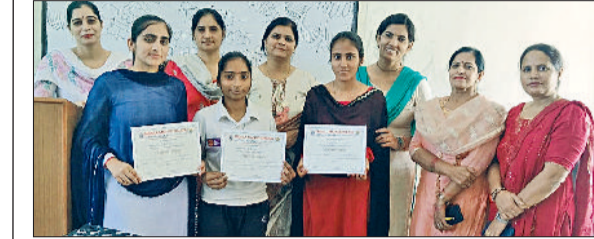
चरखी दादरी। प्रतियोगिता की विजेता छात्राओं को सम्मानित करते अतिथि।

बवानीखेड़ा। मिलकपुर स्थित आनंद स्कूल फॉर एक्सीलेस में गुरु नानक देव जयंती बड़े हर्षोल्लास और श्रद्धा के साथ मनाई। कार्यक्रम की शुरुआत प्राइमरी कक्षाओं के विद्यार्थियों द्वारा निकाली गई प्रगत फेरी से हुई, जिसमें बच्चों ने गुरु वाणी का पाठ किया और पूरे विद्यालय परिसर में पवित्र वातावरण बना दिया। बच्चों ने मधुर भजन के माध्यम से गुरु नानकदेव के उपदेशों और शिक्षाओं का संदेश दिया। कार्यक्रम में शिक्षकों ने भी सक्रिय रूप से भाग लिया और गुरुजी के जीवन से जुड़ी प्रेरणादायक बातें साझा कीं।