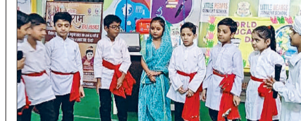
भिवानी। गुरु नानक देव जयंती पर प्रस्तुति देते विद्यार्थी।