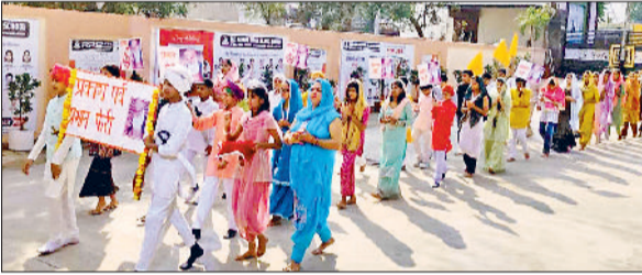
महेंद्रगढ़। रैली निकालते विद्यार्थी।