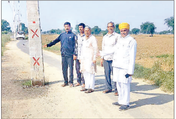
नारनौल। सड़क बीच में खड़े खंभे को दिखाते ग्रामीण।