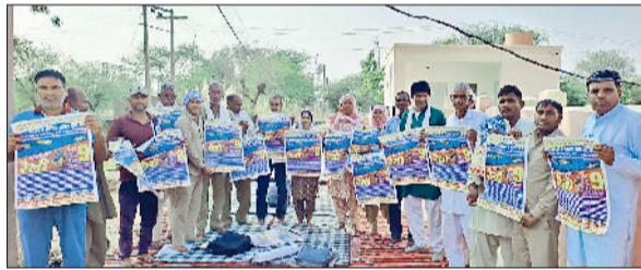
बाढ़ड़ा। रैली व अन्य मांगों को लेकर बैटक करते ग्रामीण सफाई कर्मचारी।