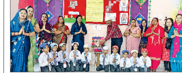
चरखी दादरी। गुरु नानक के चित्र पर पुष्प अर्पित करते।