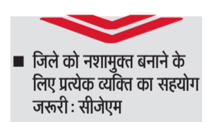
जिले को नशामुक्ति बनाने के लिए प्रत्येक व्यक्ति का सहयोग जरूरी: सीजेएम