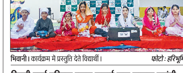
भिवानी। कार्यक्रम में प्रस्तुति देते विद्यार्थी।