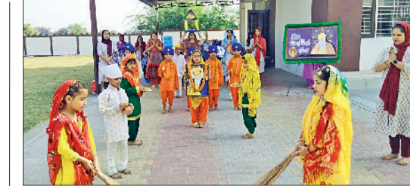
आनंद स्कूल फॉर एक्सीलेस में गुरु नानकदेव जयंती कार्यक्रम में प्रस्तुति देते